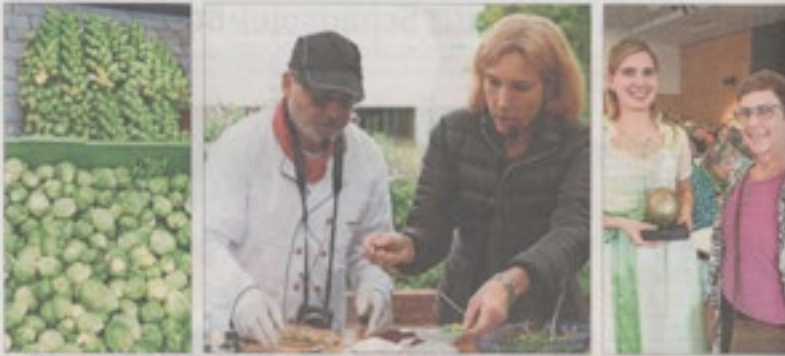
Rosenkohl-Rezepte: Kernen ist ein beliebtes Rohmaterial in Deutschland. Eine Stange pro drei Rosenkohl-Rezepte sind bestenfalls über den Tellerrand hinaus.