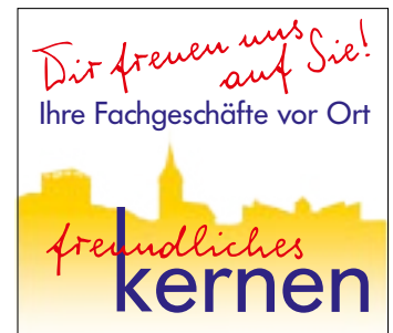
Rommelshausen Waiblinger Straße