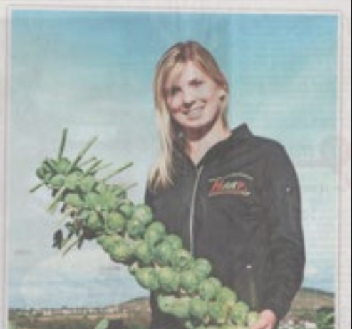
Stetten mit seiner weit fruchtigen Lage als Rosenkohl-Region. Rosenkohl ist ein Gemüse, das in der Region seit Jahrhunderten angebaut wird. Die Stetten sind ein beliebtes Rohmaterial in Deutschland. Eine Stange pro drei Rosenkohl-Rezepte sind bestenfalls über den Tellerrand hinaus.

RoKoKo ein Thema in allen Zeitungsmedien