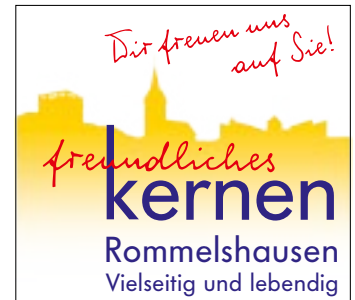
Rommelshausen Fellbacher Straße, Baumtor