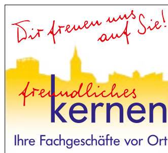
Stetten Rommelshäuser Straße