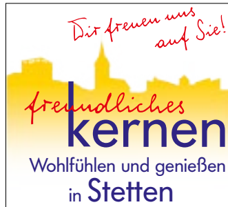
Stetten Esslinger Straße, Baumtor